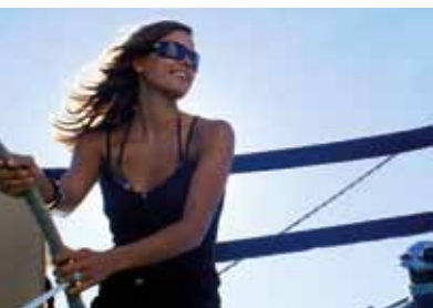
Verbreed je horizon en ga eens zeilen op zee.