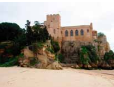
Het rossige Castelo de São João do Arade in Ferragudo.

Zonnig, maar mild. Toeristisch, maar nog net ongerept. De Algarve, is een prachtig gekleurde streek met vijgenbomen en sinaasappelplantages in het zuiden van Portugal die zowel zonnekloppers, sportfanaten als cultuurliefhebbers lokt. Wij startten onze reis in het authentieke vissersdorpje Ferragudo en verkenden van daaruit, op een gezapig vakantieritme, het zonnige zuiden, het bergachtige binnenland en de ruige westkust.