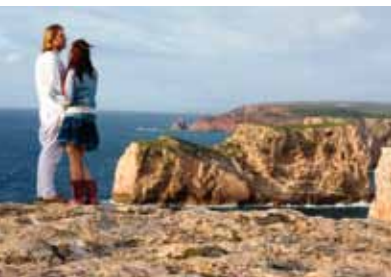
Een mooie zonsondergang in Cabo de São Vicente.

De deuren van de luchthaven in Faro schuiven voor ons open en een instant gevoel van gelukzaligheid overvalt ons. Is het de zon waar we zo naar gesnakt hebben, de pittige geuren die onze neus prikkelen of het ongetemde verlangen naar vier ongedwongen relaxdagen in het meest zuidelijke puntje van Portugal? We komen immers niet alleen in een ander land, maar ook in een ander ritme terecht. Hier geldt de regel 'stel uit naar later, wat je vandaag niet wil doen'. Het is een gevoel dat aanvankelijk wat bevreemdend overkomt, maar al even snel verdwijnt na onze eerste kennismaking met onze verblijfplaats: het kleine vissersdorpje Ferragudo . We slenteren